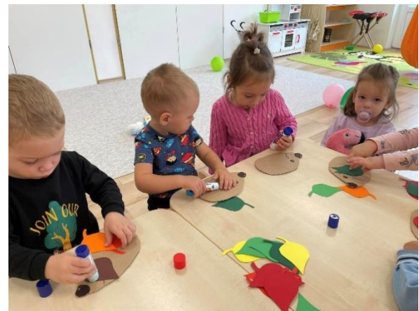
Állatok világnapja-süni ragasztása

Sikernek könyveljük el, hogy a bölcsődei férőhelyszám a 2023/2024-es nevelési évre újra megtelt. A legutolsóként beiratott kisgyermek októberben kezdte meg a beszoktatását. Szülői elégedettségi kérdőívünk alapján a szülők 99,8%-ban